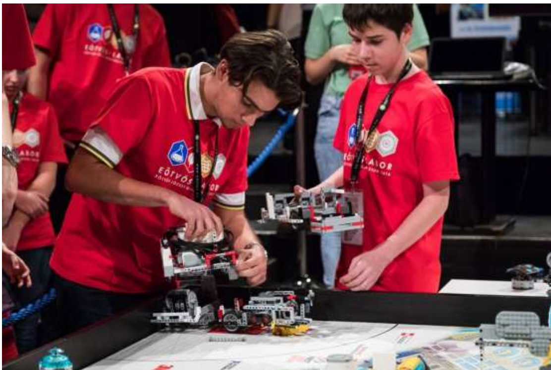
Nagy munkában a Robogo csapat