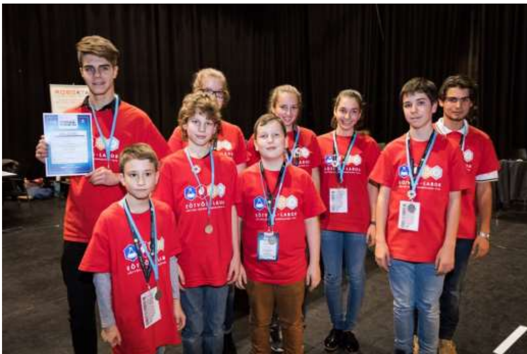
Robogo csapat az eredményhirdetés után