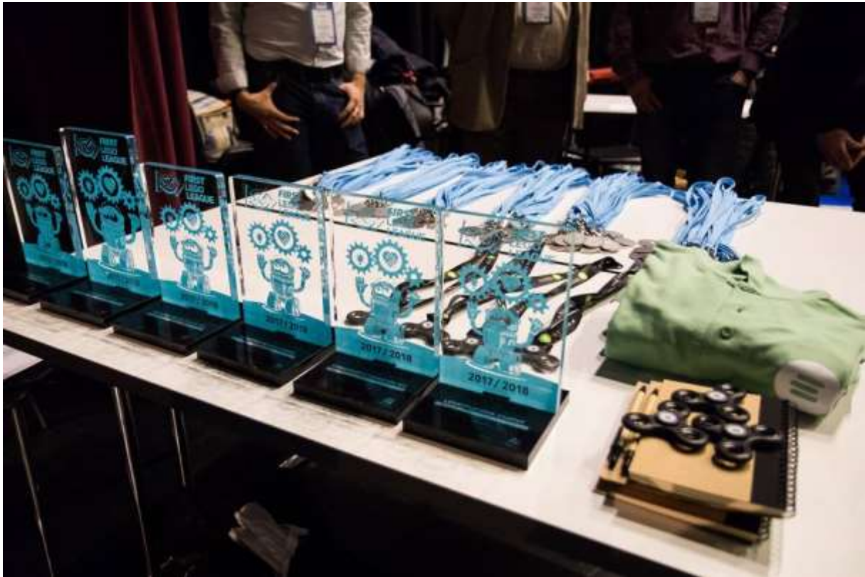
Sorakoznak a díjak